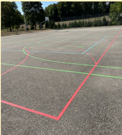
Neue Linienführung Sportplatz.