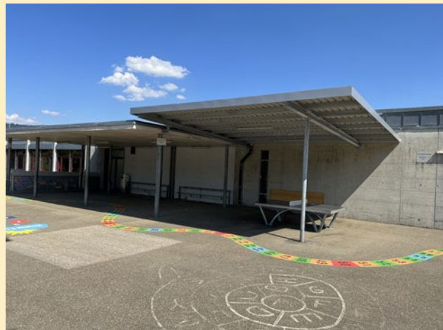
Zahlenschlange und vergrösserter Unterstand.