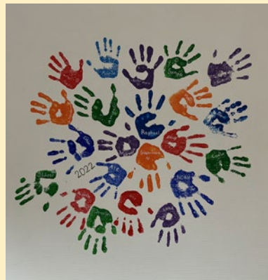
Wandbild im Flur: Händeabdrücke aller Schülerinnen und Schüler der abtretenden 6. Klasse 2022.