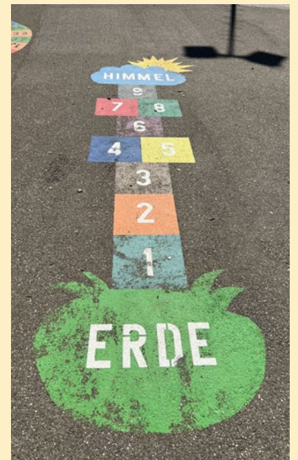
Hüpf-Spiel «Himmel und Erde».

Normalerweise sagt ja die Lehrperson, was zu tun ist – im Ideenbüro jedoch hatten wir Freiheit und Freiraum für Eigeninitiative, wir hatten unsere Projekte, unser eigenes «Unternehmen». Die Klasse kam ganz gut zurecht ohne Lehrperson, das gab uns ein gutes Gefühl, die Klasse wuchs zusammen. Im Ideenbüro habe ich gelernt, Probleme anderer zu anerkennen, Probleme als Team zu lösen, einander ausreden zu lassen, kreativ und lösungsorientiert zu sein – und: Probleme nicht mit etwas Negativem zu verknüpfen. Ich habe positive Erlebnisse mit Problemen. Davon profitiere ich heute sowohl beruflich wie privat.»