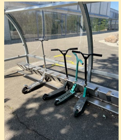
Unterstand für Kickboards.