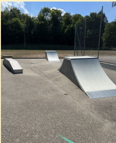
Halfpipes für Skateboards.